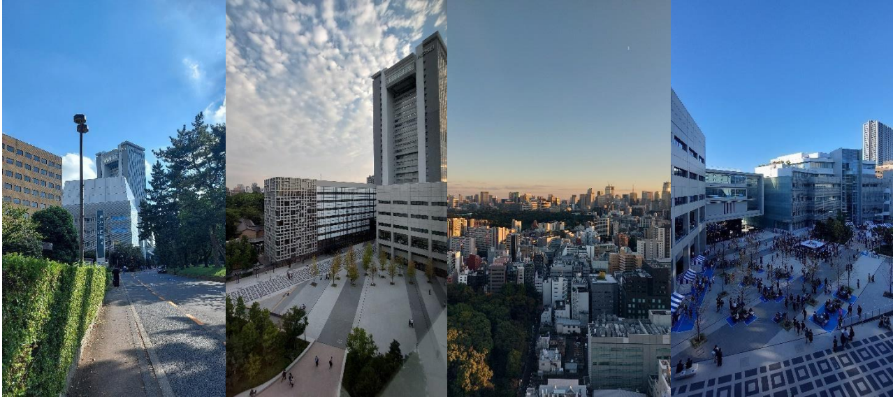
Täglicher Weg zur Uni