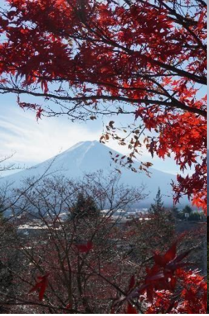
Mt. Fuji (Kawaguchi See)