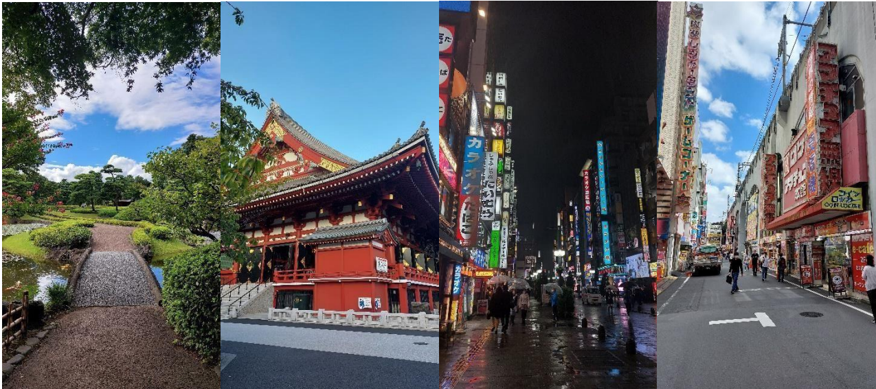
Garten am Kaiserpalast